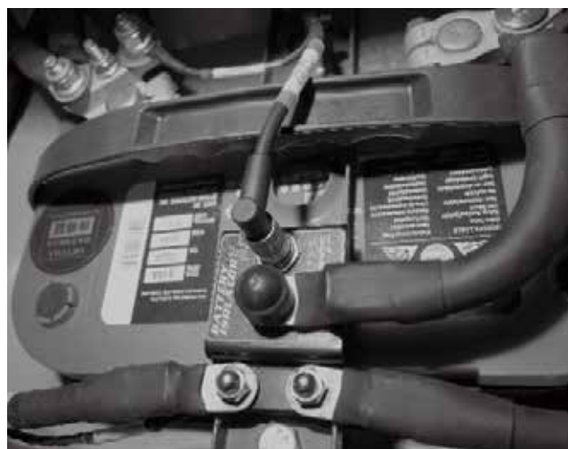
エンジンルーム取り付け例