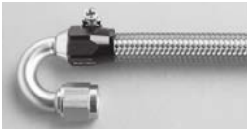
ステンレスメッシュホース(P180)×180° エンド