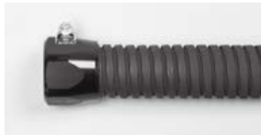
ラジエターホース(P304)