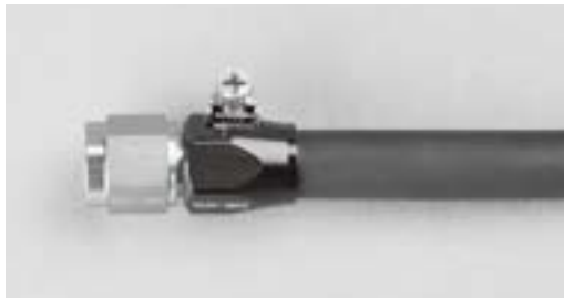
ゴムホース(P96)×エコノメイトストレート エンド