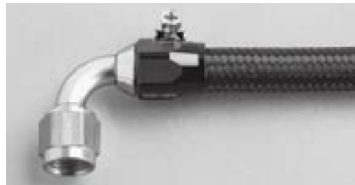
ナイロンメッシュホース(P84)×90° エンド