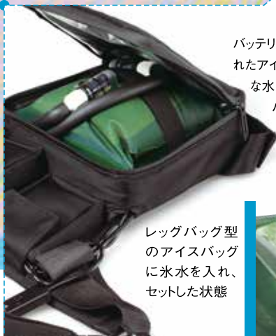
レッグバッグ型のアイスバッグに氷水を入れ、セットした状態

バッテリー駆動タイプは主に専用のアイスバッグを使用します。水を入れたアイスバッグを直接冷凍させたり砕いた氷を投入し、循環に必要な水を注入して使用します。オプションのアイスバッグを追加してクーラーボックスで複数準備することで簡単にアイスバッグを交換でき、長時間の運用がスムーズになります。