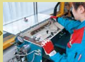
プレッシャーチェック