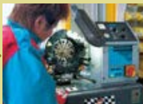
プラスカラークランプ