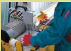
専用マシンでのホースカット

ラン・マックスブレーキラインシステムはストリートカーはもちろんレース車輛にもその能力を発揮します。ホースの膨張をおさえ、ダイレクトで剛性感の高いブレーキフィールが得られると同時にリニアなレスポンスはコントロール性能を飛躍的に向上させます。