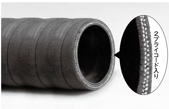
2プライコード入り

※基本的には1mの販売ですが、端数の有る場合もあります>>>ご相談下さい。 ※上記はANホースサイズ(P83、P179)の規格では有りません。