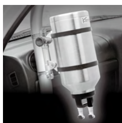
ロールバーに取り付け