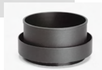
ダクトアダプター付