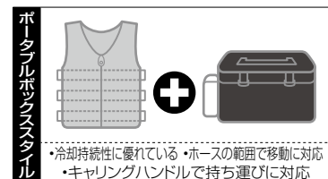
ボックススタイル