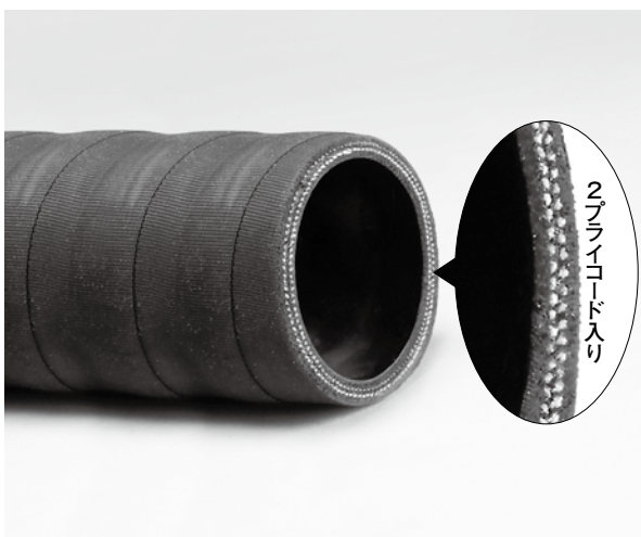
2プライコード入り

〔お断り〕このホースに関しましては製造工程上表記サイズに多少のバラツキ(±0.5mm程度)が出る場合がありますので、ご了承下さい。