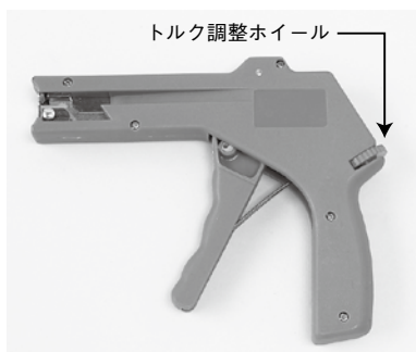
トルク調整ホイール