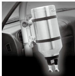
ロールバーに取り付け