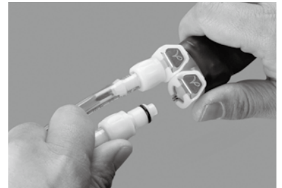
クイックリリース シャツ脱着側