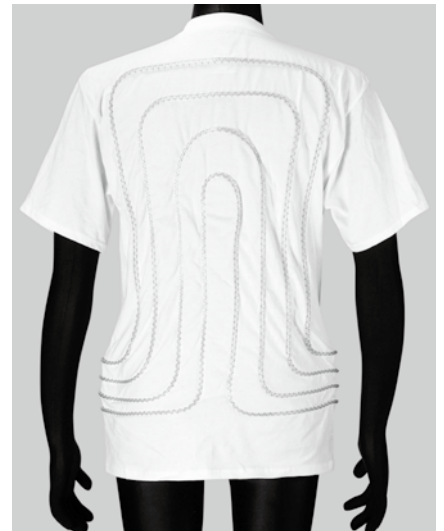
シャツ背面(センター出し)

スペース的な問題は関係なく容量的な問題を重視しました。主に長時間レース用として…。