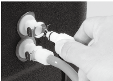
クイックリリース クーラーBOX脱着側