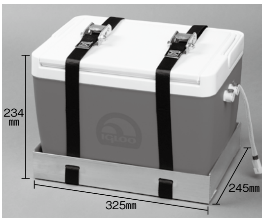
クーラーBOX(固定用底板付)