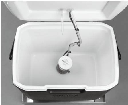
容量:約26ℓ(ラージクーラーBOX 内部)