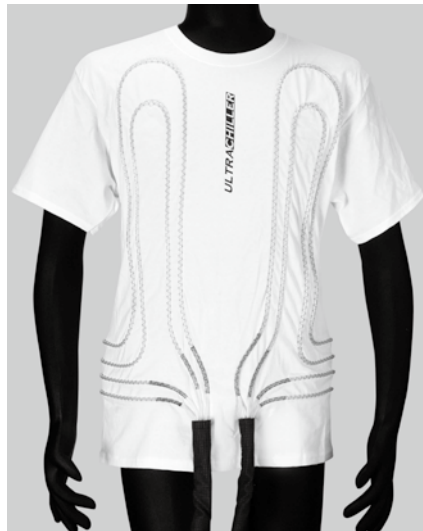
シャツ前面(センター出し)