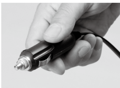
電源用シガーライタープラグ