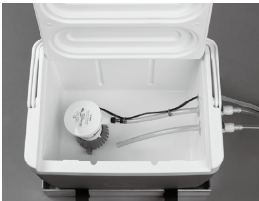
容量:約8.5ℓ(スモール)クーラーBOX 内部