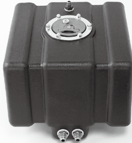
250-005 / 250-008

内部にはガソリンの波うち防止用として、全機種にフォーム(セーフティスポンジ)封入。軽量で比較的安価なタンクです。