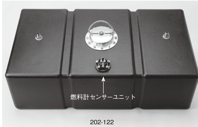
燃料計センサーユニット