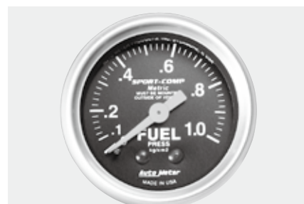
燃圧計キャブ車 ¥11,800 3311-KN ●0~1.0kg/cm 2 ●2"1/16(52φ)/56φ×D40mm ●ブラックパネル/ホワイトスケール