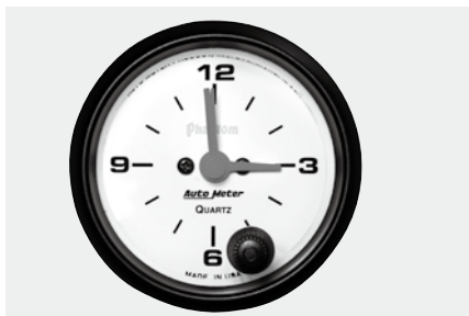
クロック(時計) ¥15,500 5785-K ●12V ●2"1/16(52φ)/56φ×D40mm ●ホワイトパネル/ブラックスケール

●オートメーター 2"1/16(52φ) METRIC GAUGES(日本表示) SPORT-COMP MECHANICAL(機械式)