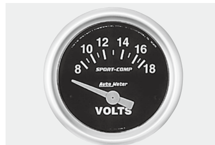
電圧(ボルト)計 ¥10,000 3391-K ●8~18V ●2"1/16(52φ)/56φ×D40mm ●ブラックパネル/ホワイトスケール