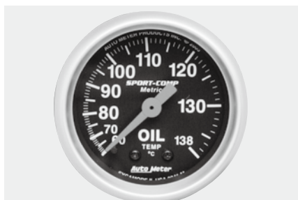
油温計 ¥17,200 3341-K ●60~138℃ ●2"1/16(52φ)/56φ×D40mm ●ブラックパネル/ホワイトスケール