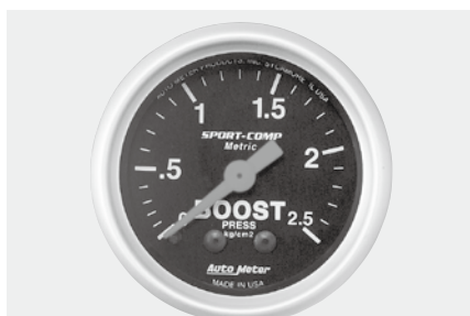
ブースト計 ¥12,700 3304-K ●0~2.5kg/cm 2 ●2"1/16(52φ)/56φ×D40mm ●ブラックパネル/ホワイトスケール