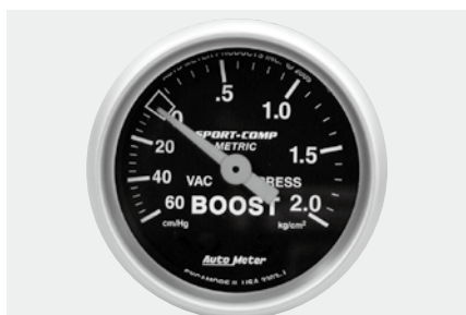
連成計 ¥13,200 3303-K ●-60~2.0kg/cm 2 ●2"1/16(52φ)/56φ×D40mm ●ブラックパネル/ホワイトスケール