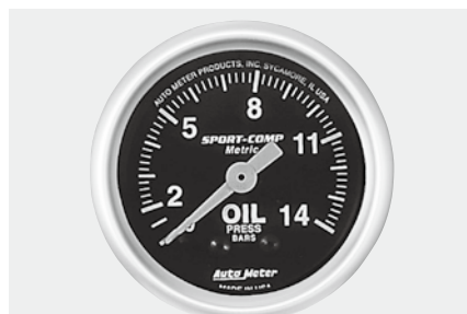
油圧計 ¥11,900 3322-K ●0~14Bar ●2"1/16(52φ)/56φ×D40mm ●ブラックパネル/ホワイトスケール