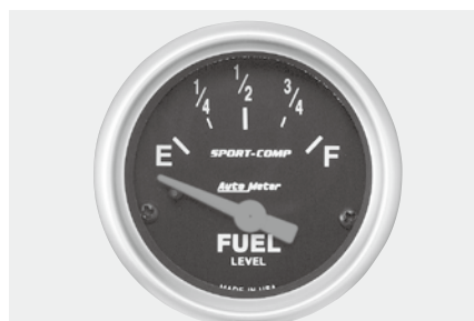
燃料計 ¥9,800 品番は右へ表示 ●2"1/16(52φ)/56φ×D40mm ●ブラックパネル/ホワイトスケール

※使用するセンサーユニットの抵抗値(E-F)を測定して下記よりお選び下さい。 又、抵抗値が下記からはずれている場合や判らない場合は、P210 品番 3310をおすすめします。 他、国産車の場合たとえ抵抗値が合っているも純正センサーにうまく反応しない場合も有ります。(配線図はP255 参照して下さい。)