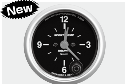
クロック(時計) ¥15,500 3385-K ●12V ●2"1/16(52φ)/56φ×D40mm ●ブラックパネル/ホワイトスケール