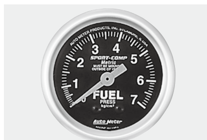
燃圧計インジェクション車 ¥11,900 3312-KN ●0~7.0kg/cm 2 ●2"1/16(52φ)/56φ×D40mm ●ブラックパネル/ホワイトスケール