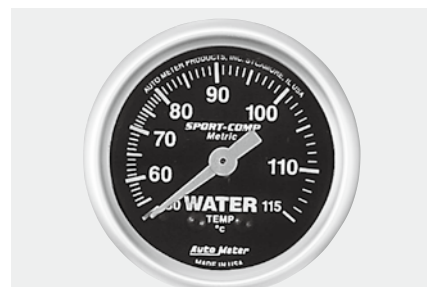
水温計 ¥17,200 3332-K ●50~115℃ ●2"1/16(52φ)/56φ×D40mm ●ブラックパネル/ホワイトスケール