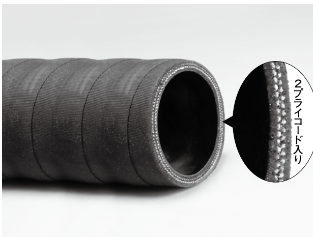
2プライコード入り