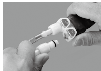
クイックリリース シャツ脱着側