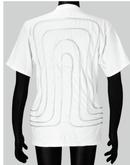
シャツ背面(センター出し)

スペース的な問題は関係なく容量的な問題を重視しました。 主に長時間レース用として…。