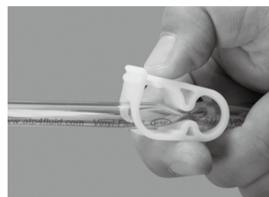
フローアジャスター