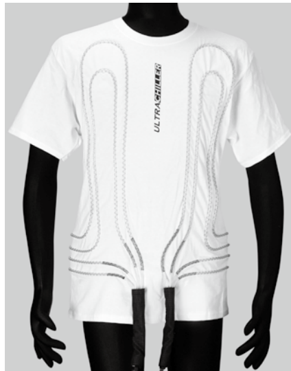
シャツ前面(センター出し)