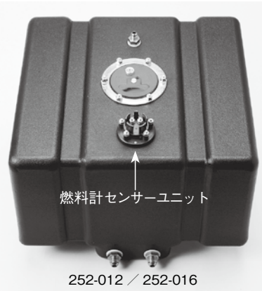
252-012 / 252-016