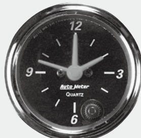
クロック(時計)ベゼルブラックメッキ ¥12,600