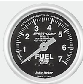
燃圧計インジェクション車 ¥11,900